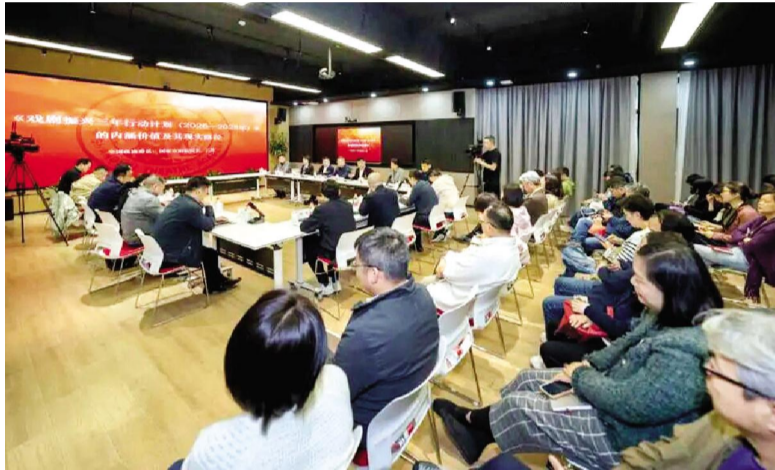
王勇围绕支持戏剧院团发展、提高剧目创作质量、提升作品评价和资金资助效能、夯实戏剧人才队伍建设基础、推动戏剧演出提质增效、加强戏剧保护传承、加强戏剧普及推广交流这七个方面,结合国家京剧院的一线实践和自身艺术管理经验,分享了深刻见解。他强调持续推进戏剧院团管理人才的重要性,管理者既要有情怀,又要懂艺术规律,既要洞察时代脉搏,又有开放学习的视野,院团长是专业精神全面又兼顾管理科学能力的全能型、复合型人才。他表示,剧目创作要坚持“守正创新”,深刻把握本剧种的艺术特点,清晰明确本剧种的风格定位,杜绝脱离艺术本体、不计成本的大制作。他还提到,人才培养要打通学与用的壁垒,让课堂所学转化为舞台的实践能力,让青年演员在掌声与批评中锤炼真功夫,真正破解人才成长的瓶颈。

本次学习会特邀全国政协委员、中国国家京剧院院长、一级编剧王勇作主题报告。主题报告围绕《戏剧振兴三年行动计划(2026—2028年)》,从文件出台背景、核心内容、实施路径等方面进行了全面深入的解读。王勇指出,《戏剧振兴三年行动计划(2026—2028年)》与《关于深化国有文艺院团的改革意见》《关于支持戏曲传承发展的若干政策》《关于推动文化高质量发展的若干经济政策》等共同构成新时代关于文艺团体和文艺政策的文件体系,涵盖“一个要求、七个方面、一个保障”,充分体现了对艺术规律的尊重。