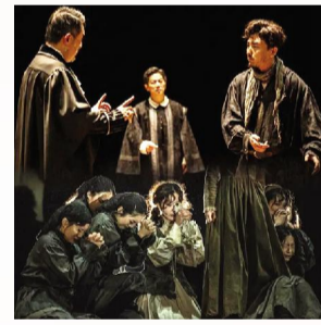
台,推动研究生培养质量不断提升,为戏剧行业输送兼具专业素养与实践能力强的人才。(文/表演系)

未来,上海戏剧学院表演系将持续深化与专业院团的合作,进一步拓展产教融合路径,搭建更高层次的实践平